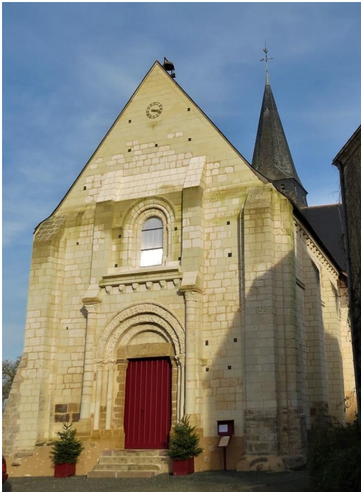
L'église de Sarcé, en 2019, après une importante restauration qui a duré près de 25 ans

«Dans cette année [1742], M r Chevalier, prêtre et chapelain de Saint-Laurent en l'église de Sarcé, par ses soins et par des aumônes, a fait lembrisser l'église.»