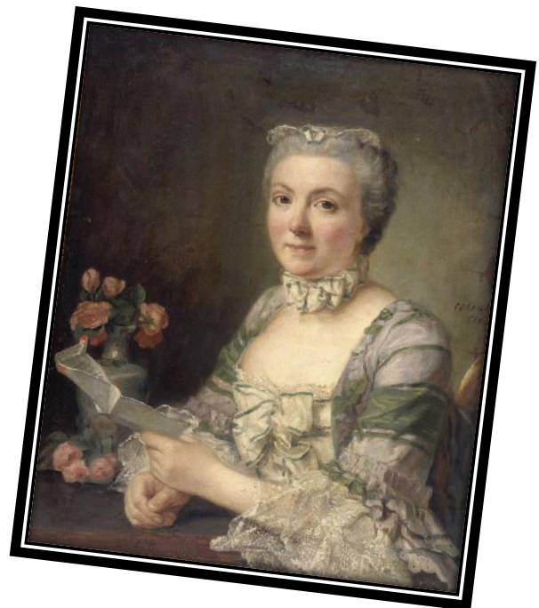
François Véron de Forbonnais et Madame